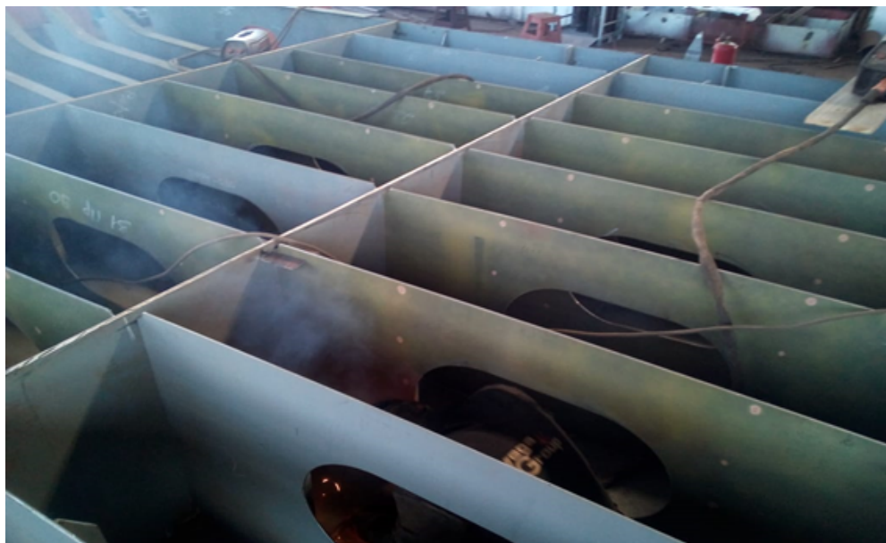
Работы по днищевой секции