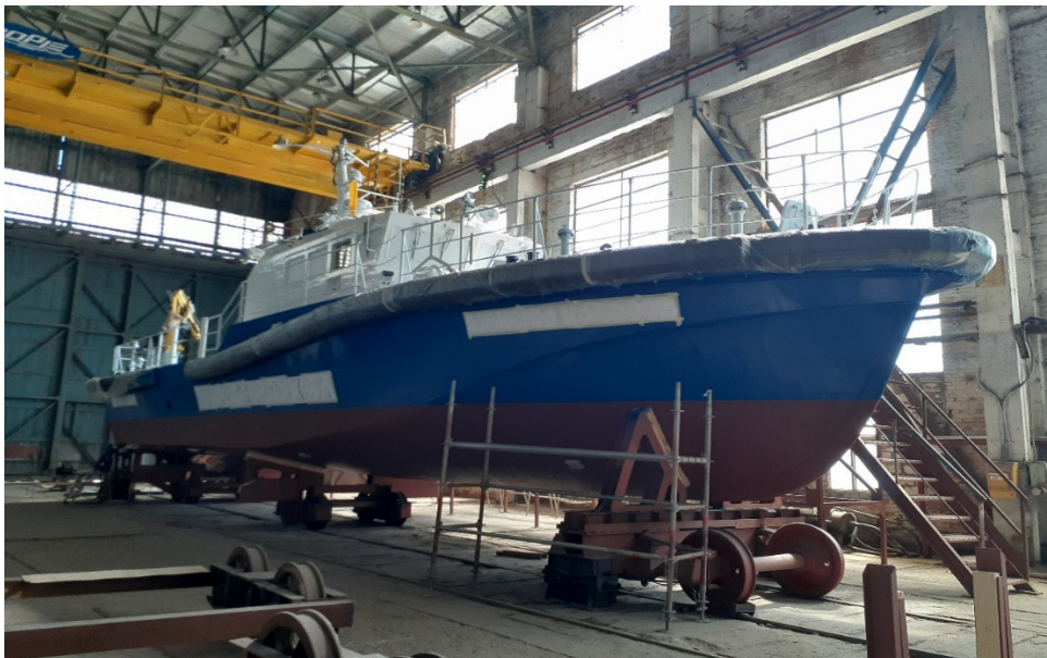
Строящийся катер №1