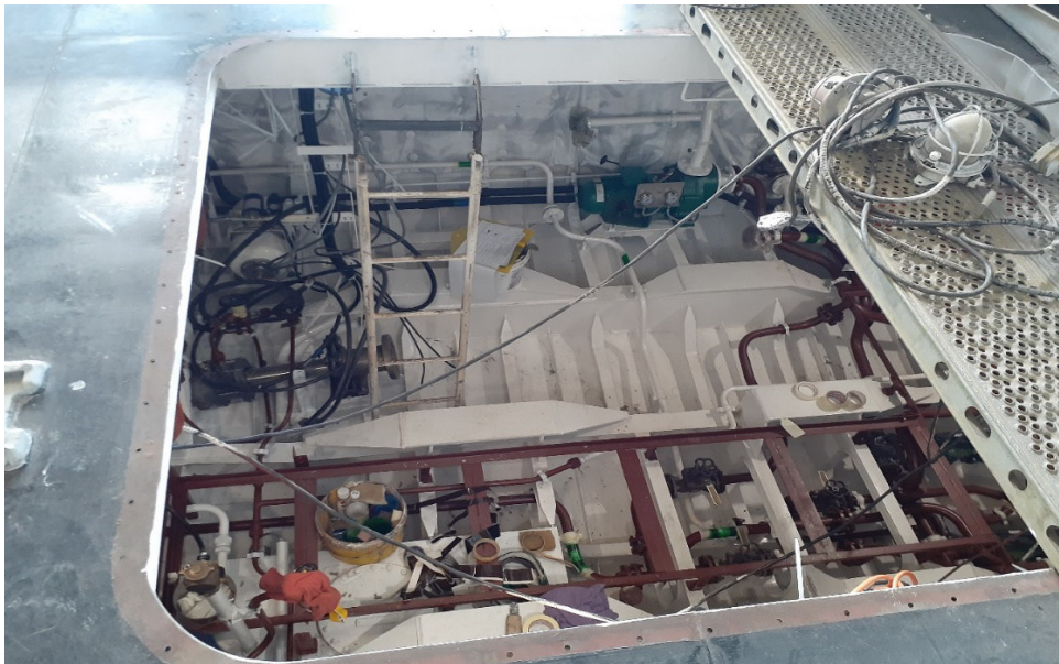
Машинное отделение строящегося катера