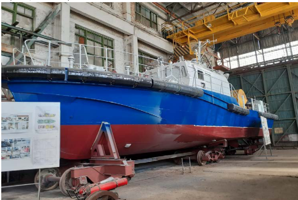
Строящийся катер №2

Срок сдачи спасательных катеров-бонепостановщиков – декабрь 2020 года.